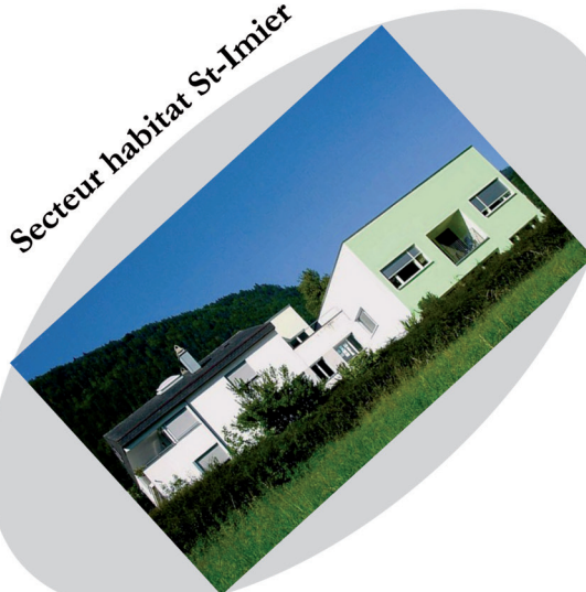
Secteur habitat St-Imier