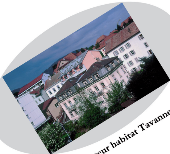
Secteur habitat Tavannes