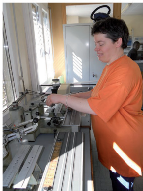
CAROLE : GRAVAGE DE DIVERSES PLAQUETTES D'IDENTIFICATION.