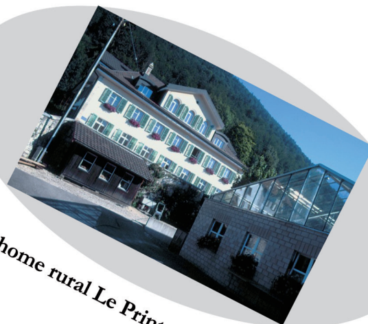
Secteur home rural Le Printemps St-Imier