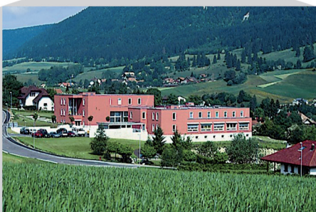
Secteur résidence L'Aubue Malleray