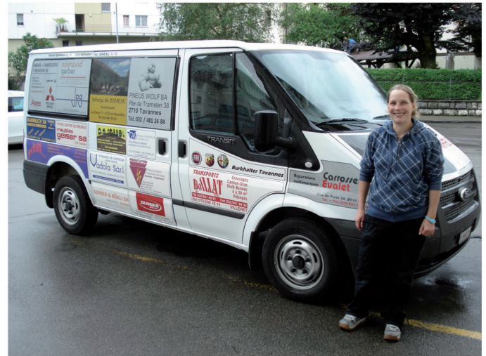
MERCI AUX ENTREPRISES RÉGIONALES DONT LE SOUTIEN PUBLICITAIRE A PERMIS DE POUVOIR BÉNÉFICIER D'UN NOUVEAU VÉHICULE

J'adresse ici mes plus vifs remerciements :